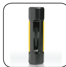
Κλιπ Τσέπης/ Ζώνης