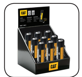
CT34109 Χάρτινο Εκθετήριο