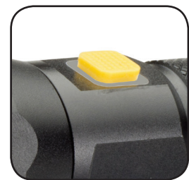
Διακόπτης 3 Λειτουργιών