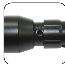
Προστατευόμενη θύρα φόρτισης