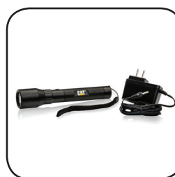
Επαναφορτιζόμενη Μπαταρία Lithium-ion